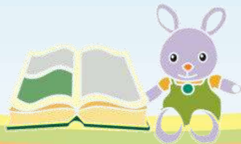
ПРИМЕРНЫЙ РЕЖИМ ДНЯ

Важное значение для здоровья и благополучного развития детей имеет правильная организация режима питания, сна, бодрствования, прогулок, проведения гигиенических процедур.